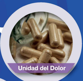
Unidad del Dolor