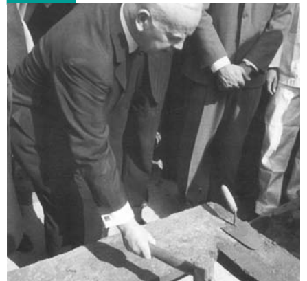
El Presidente de la República Federal Alemana, Dr. h.c. Heinrich Lübcke, coloca la primera piedra de la Clínica Alemana en Vitacura.